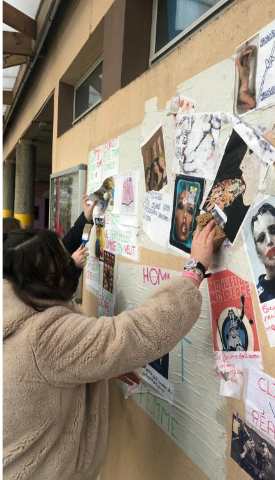
Séance de collage avec les collégien.nes du collège La Vanlée à Bréhal