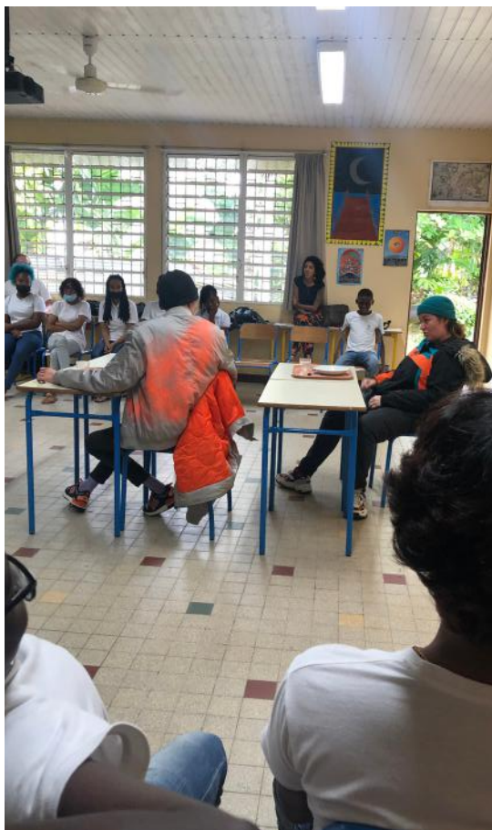
Représentation au collège Tell Eboué, Saint-Laurent du Maroni (Guyane)