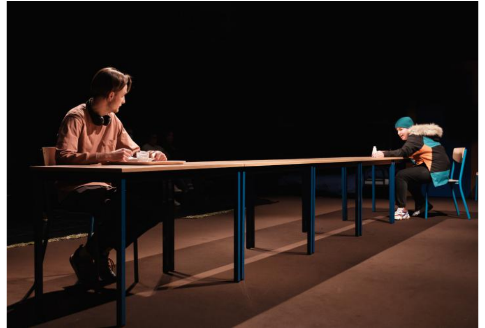
La même scène en version salle de spectacle