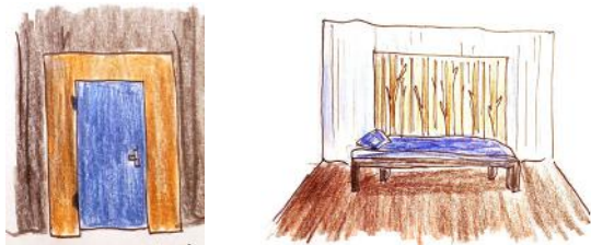
Croquis préparatoires de Cerise Guyon