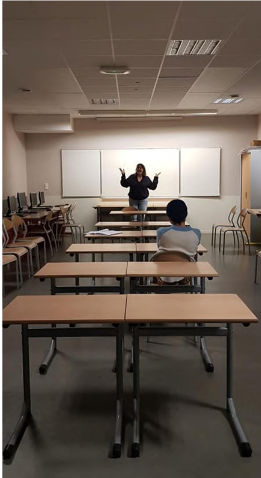
Répétition au collège Sévigné de Flers