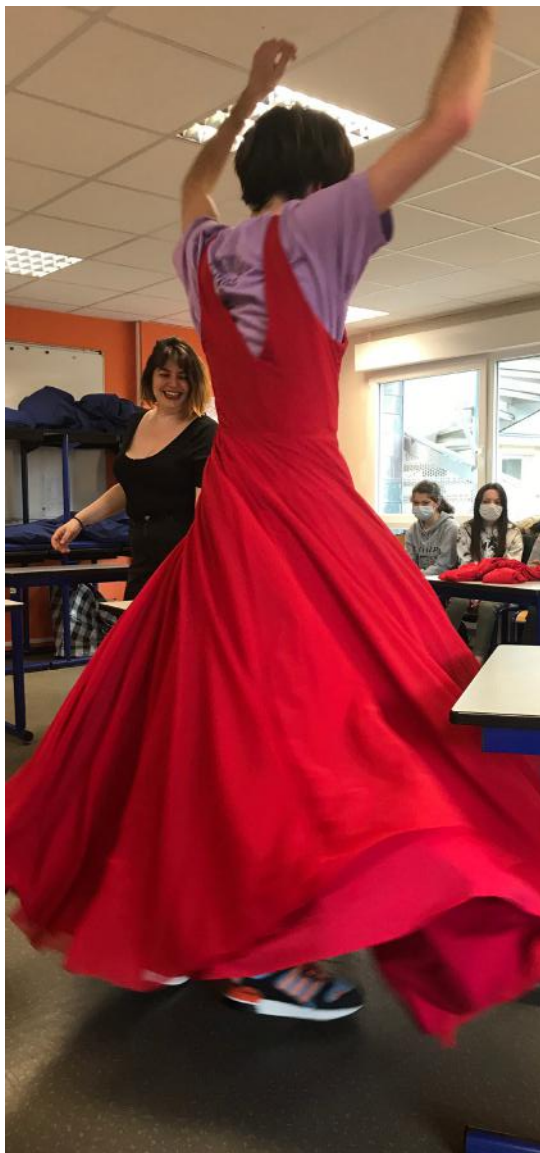
Répétition publique au collège Tancred de Hauteville de Saint Sauveur Lendelin