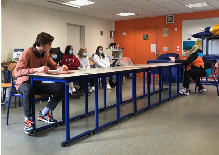
Répétition publique au collège Tancrede de Hauteville de Saint Sauveur Lendelin